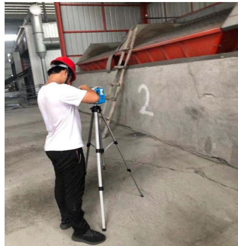
衢州市市政建设开发有限公司加料岗位