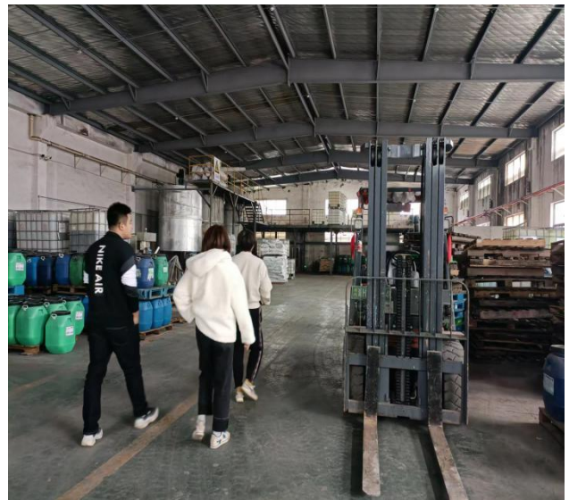
浙江汉桑工贸有限公司车间