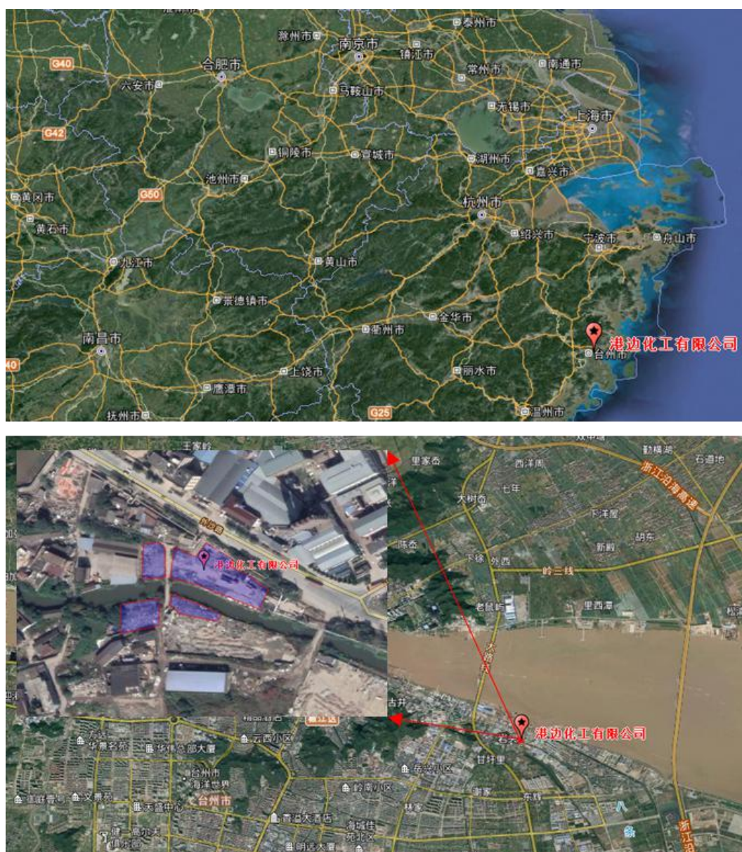
图 2.1-1 台州市港边化工有限公司地理位置

台州市港边化工有限公司地块位于浙江省台州市椒江区绿色药都小镇，地址为台州市椒江区海门街道岩头工业区外沙路与滨海路交叉口西 150m 处，占地面积为 4770.8m 2 。地块中心坐标东经 121.479°，北纬 28.671°，地块地理位置见图 2.1-1。