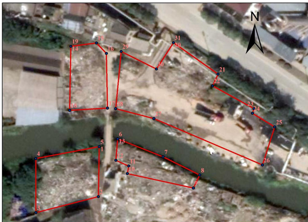
图 1.4-1 台州市港边化工有限公司调查范围