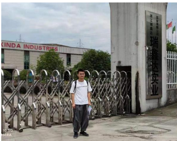
浙江瑞鑫达实业有限公司公司门口